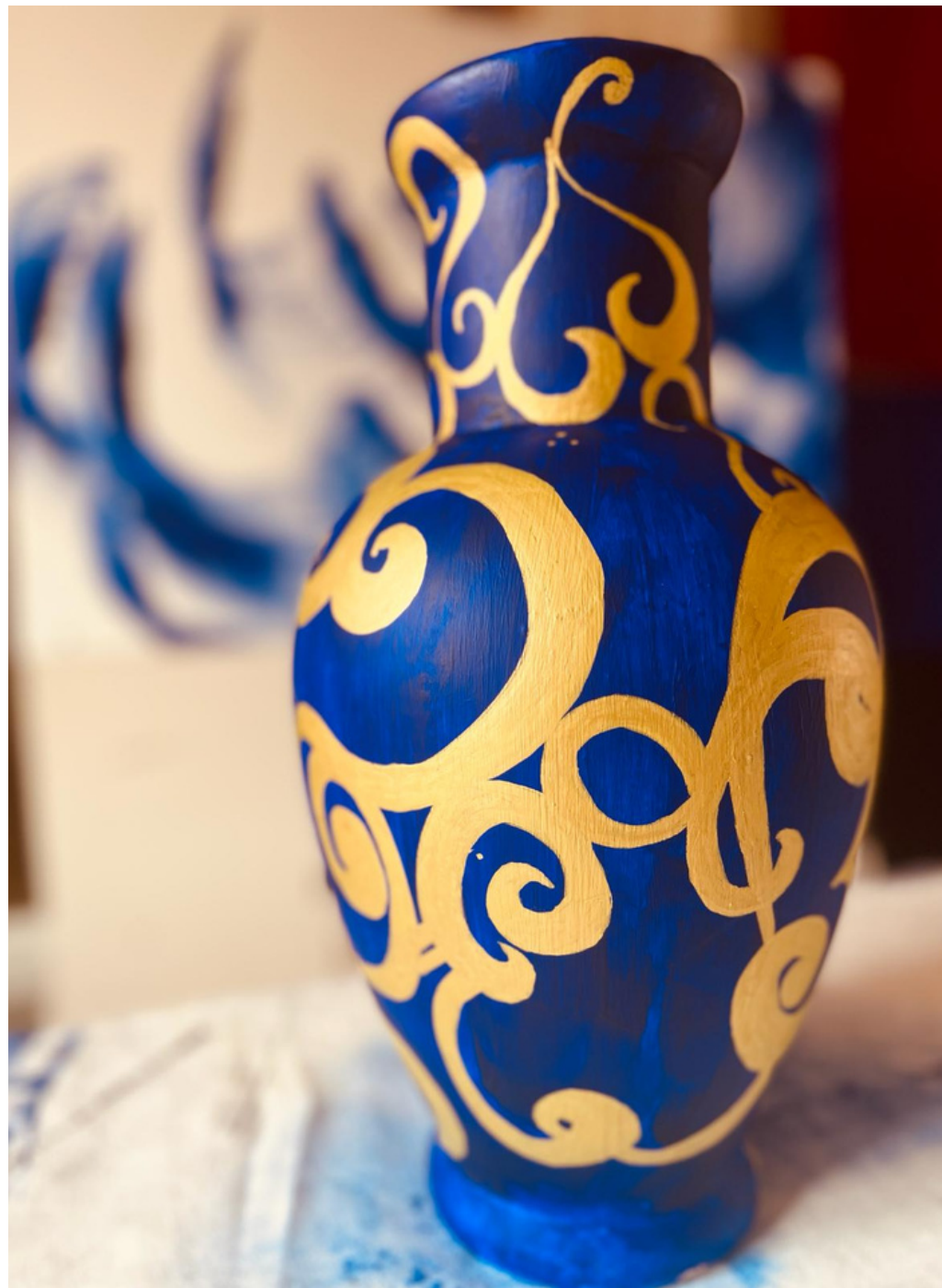
Vase by G