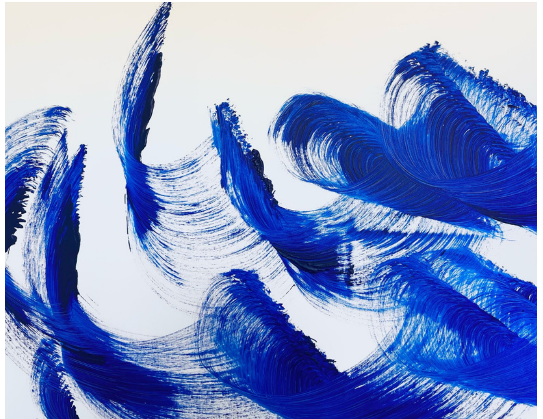
Une femme à la peau bleue

“À travers ce bleu intense et profond que je décline sur mes toiles, ce sont toutes ces vagues de notre Méditerranée qui se révèlent, mais aussi la sensualité, la féminité, le caractère et la personnalité des femmes du Sud” GA