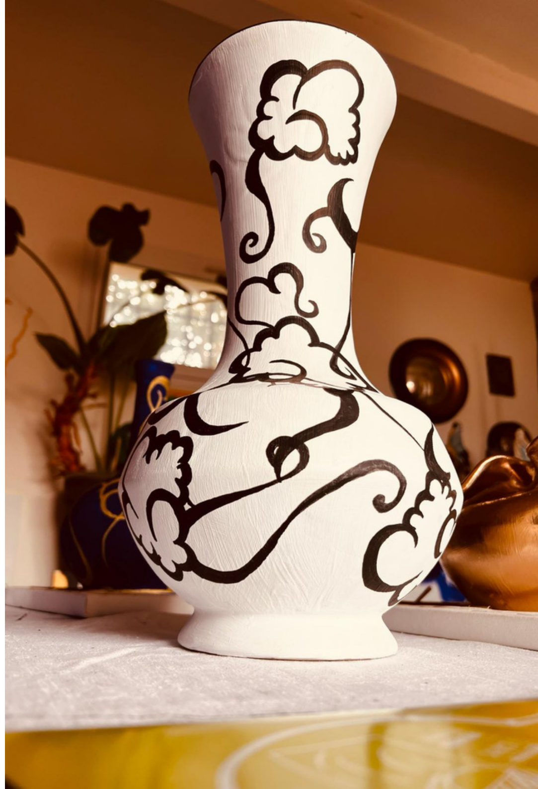
Vase by G

Inspirés du bleu de ses voyages en Égypte, au Maroc et à l'Île Maurice, les "Vases by G" dévoilent un air de Méditerranée avec douceur et sensualité. Chaque vase ancien est unique et a déjà eu une histoire. La créatrice les choisit pour leurs formes féminines et douces. Elle y appose ses pinceaux, les orne de motifs arabesques presque calligraphiques pour leur offrir une nouvelle vie.