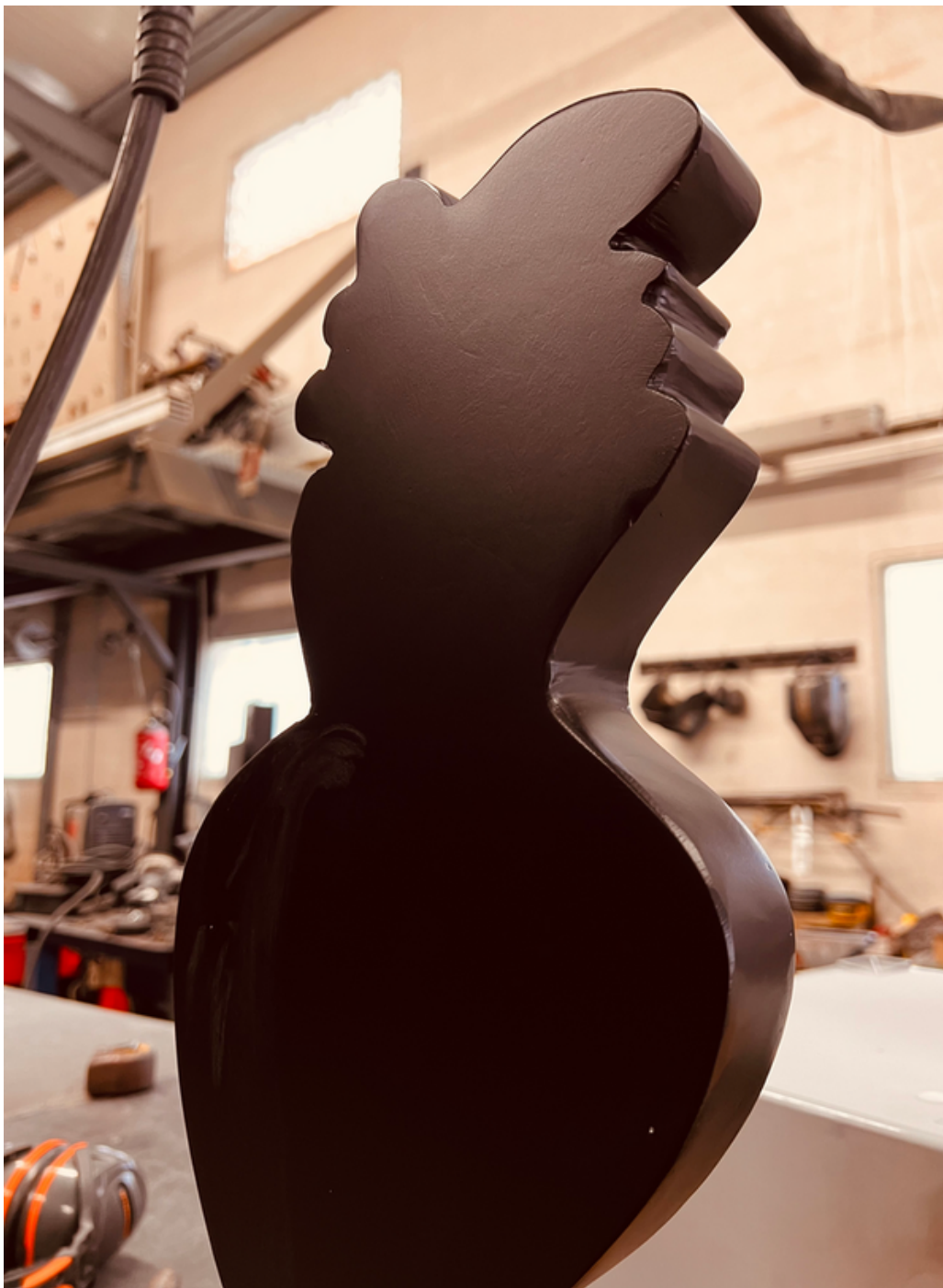
Sculpture Mademoiselle G